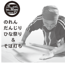
のれん だんじり ひな祭り & そば打ち

打ちたて、茹でたてのざるそばを食べられます。細めに打ち上げ、ほどよくコシがある麺。数ヶ月寝かせたかえしに昆布とかつお出汁で作ったつゆ。本格的なそばをお楽しみいただけます。その美味しさは、地元住民にも評判です。ぜひお召し上がりください。